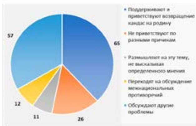
Рисунок 1 - Анализ реакций по статье «Переехали ради будущего детей. Казахи из Туркменистана прибыли в Павлодарскую область»

Материал, как писалось выше, несет позитивный заряд, рассказывает о радости вернувшихся на родину. Однако авторы отметили, что настроение респондентов не меняется от контента материала (см. Рисунок 1).